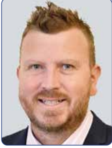
أنطوني دونيلان مدير BIPM