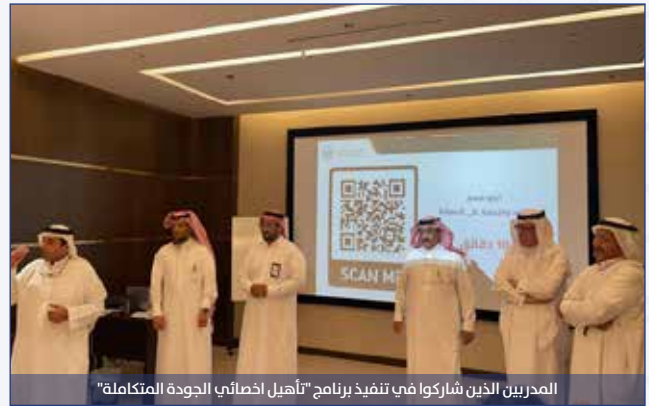
المدرّبين الذين شاركوا في تنفيذ برنامج "تأهيل أخصائي الجودة المتكاملة"