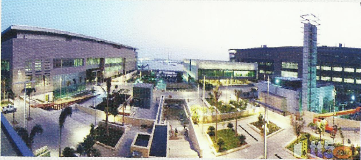
جامعة الملك عبد الله للعلوم والتقنية تتبنى أعلى معايير الجودة

مسيرة الجودة والتميز ببلادنا الحبيبة، ونحن نتطلع بشوق ولهفة إلى اكتمال هذا المشروع الوطني المهم وسنبذل كل جهد ممكن لدعم و تعزيز جهود الهيئة في هذا الخصوص لأننا ندرك تماما أهمية هذه الإستراتيجية في توحيد و تعزيز كافة الجهود المبذولة حاليا لنشر ثقافة الجودة ورفع مستوى الجودة والإتقان بالمنتجات والخدمات المحلية، كما أنه سيكون لها أثر إيجابي إن شاء الله في رفع مستوى الإهتمام بالجودة في أجنحة المسؤولين والقيادات الوطنية بمختلف قطاعات الأعمال الحكومية والخاصة.